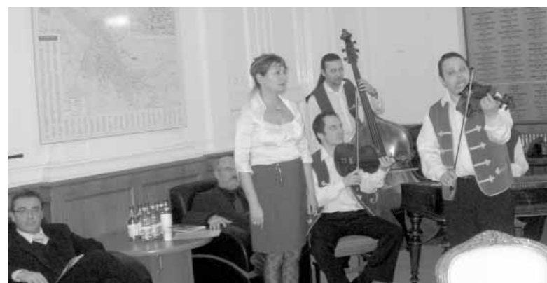
Hangulatosan, korabeli katonanóták előadásával kezdték a szombati bemutatót